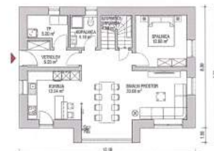
PRITLİČJE 77,31 m 2

Ytong je gradbeni material iz porobetona, ki ga že več kot 40 let proizvaja tovarna iz Kisovca pri Zagorju. Proizvajajo ga v različnih oblikah: kot zidne bloke, plošče, preklade, armirane izdelke ali polnila za izvedbo medetažnih ali strešnih konstrukcij. Glavna značilnost materiala Ytong