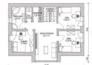
MANSARDA 76,74 m 2